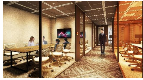
ゲストエリア（会議室コーナー）