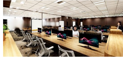
ワークエリア（プロジェクト型）