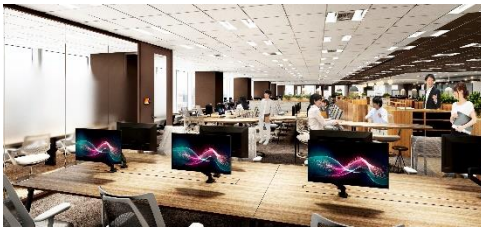
ワークエリア（フリーアドレス型）